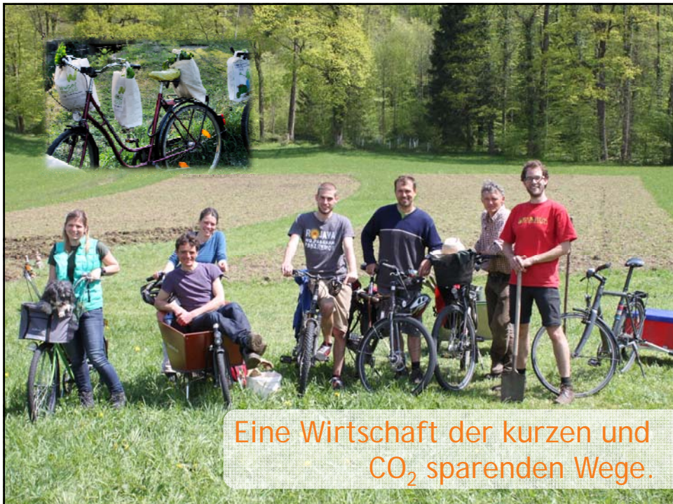
Eine Wirtschaft der kurzen und CO 2 sparenden Wege.