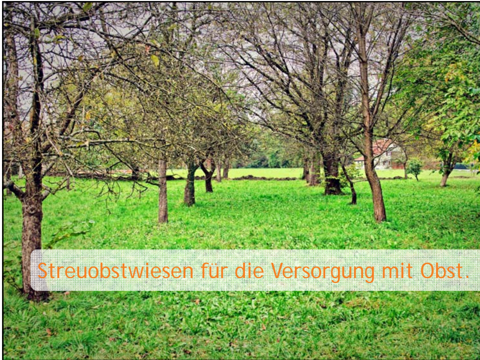
Streuobstwiesen für die Versorgung mit Obst.